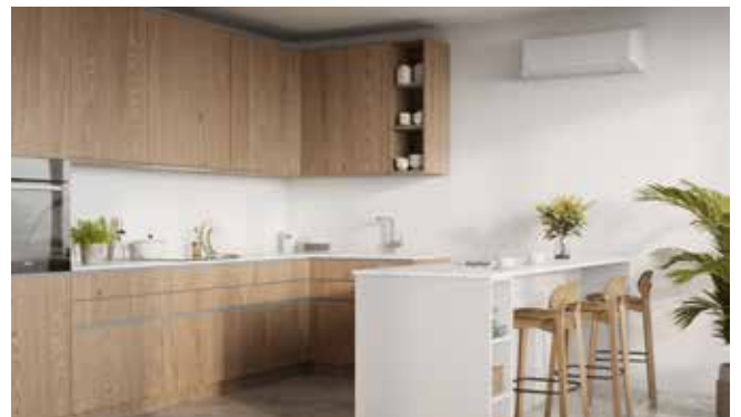
Príklad aplikácie jednotky Shorai Premium