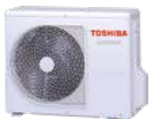
Vonkajšia jednotka (symbolické znázornenie)

→ Moderný kompaktný inverter Trieda A++ pri chladiacej prevádzke Režim Quiet Mode pre vonkajšiu a vnútornú jednotku