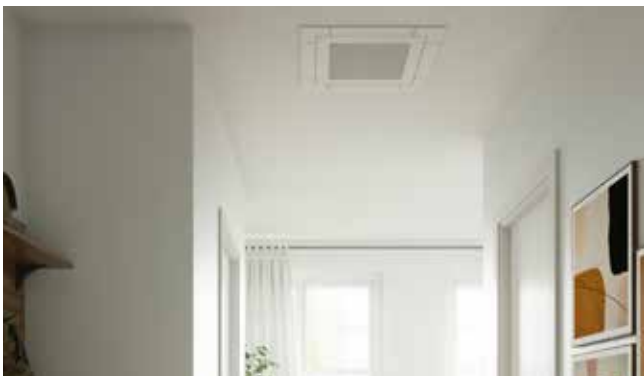
Príklad aplikácie slim kazety

2M = Multi Split pre 2 miestnosti, 3M = Multi Split pre 3 miestnosti, 4M = Multi Split pre 4 miestnosti, 5M = Multi Split pre 5 miestností