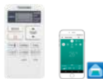
Štandardné diaľkové ovládanie s časovačom Off a funkciami tichej prevádzky